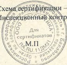
Схема сертификации – 3с. Инспекционный контроль – август 2021 года, август 2022 года.